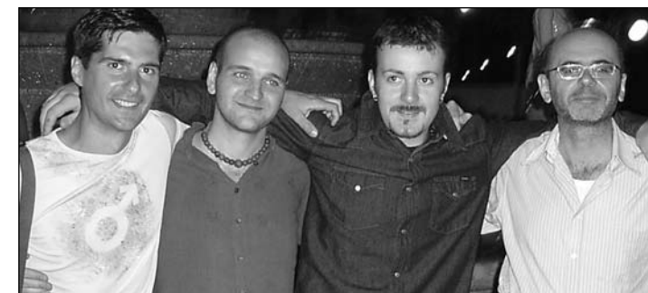
Il Notturmo Concertante